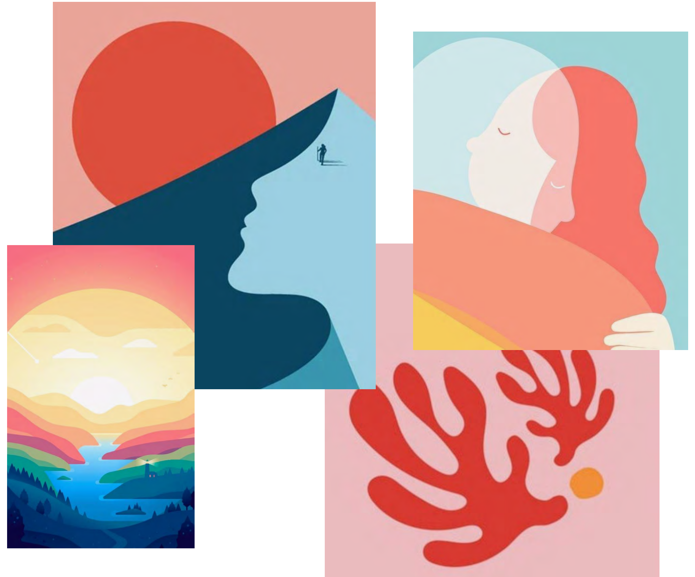
Illustration de style «flat» avec des aplats de couleurs chaudes et froides (rose, bleu Mentalo). Formes courbes qui évoquent la nature ou des silhouettes humaines. La présence de formes rondes ou l'évocation du soleil, de paysages exotiques (îles, jungle, plage...) sont recommandés.