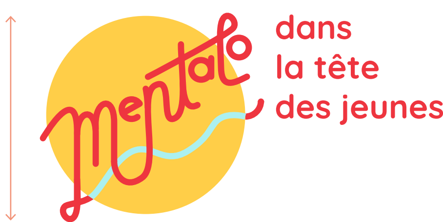
Taille minimum h 170 px / 6 cm